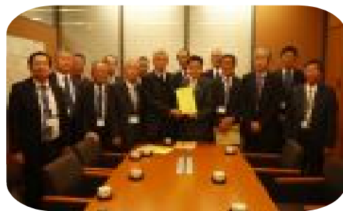
古川 康 衆議院議員