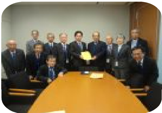
福岡資麿 参議院議員