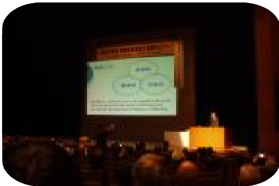
農業者年金加入推進セミナー