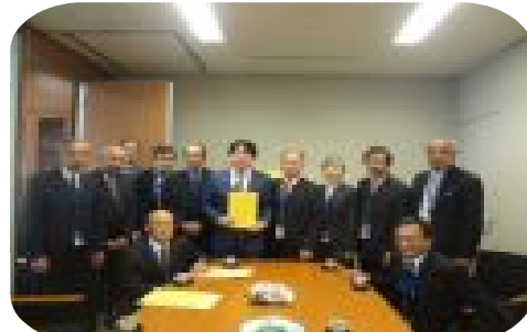
山下雄平 参議院議員