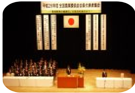
全国農業委員会会長代表者集会

農業者年金加入推進セミナーでは、3事例ともに加入推進班による計画的な戸別訪問の取り組みを紹介され、特に玉名市農業委員会は平成28年度の1年間で経営主や後継者、女性農業者の加入など36名もの加入に結び付いた成果が報告されました。