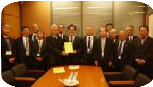
岩田和親 衆議院議員